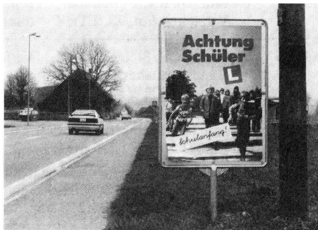
Aktionsplakat zum Schulanfang.

Heute beschäftigt die bfu rund 50 Vollprofis, worunter Ingenieure, Psychologen, Juristen und Lehrer. Über das ganze Land verteilt setzen sich seit 1973 zahlreiche, durch die Gemeinde gewählte, Sicherheitsdelegierte (heutiger Stand ca. 1'200) für die bfu-Ziele ein. Sie fördern auf lokaler Ebene die praktische Sicherheitsarbeit und führen ihre Tätigkeit ehrenamtlich aus.