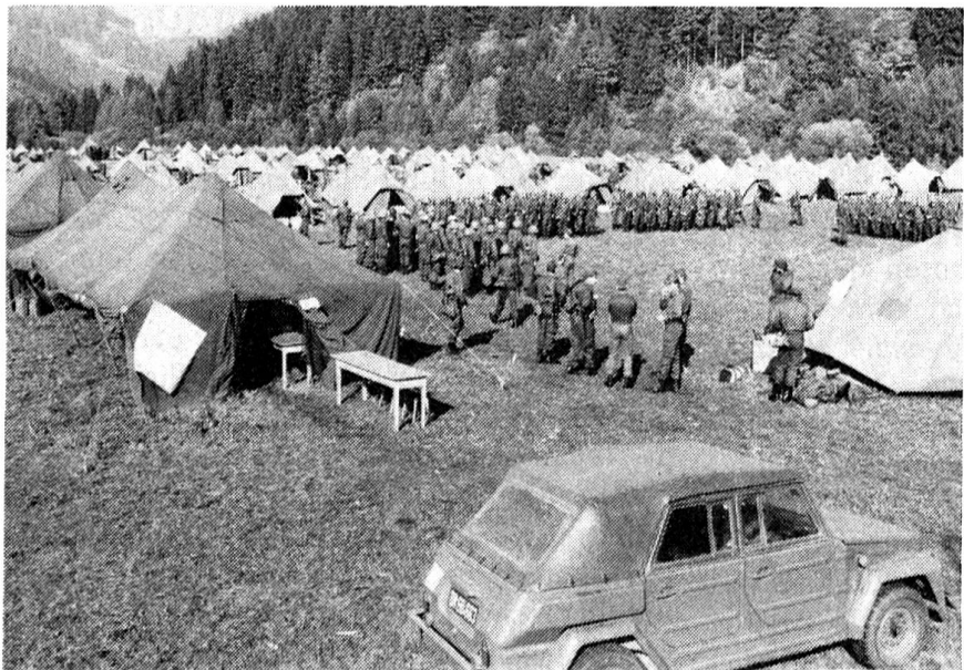
Schwergewichte der Ausbildung im österreichischen Bundesheer.