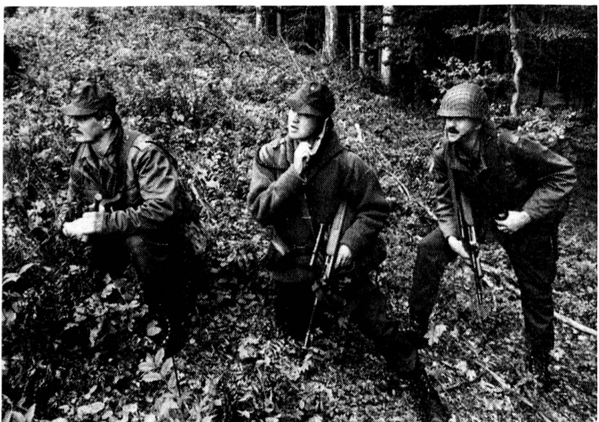
Spähtrupp im Einsatz