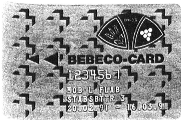
Muster einer BEBECO-Karte (verkleinert)