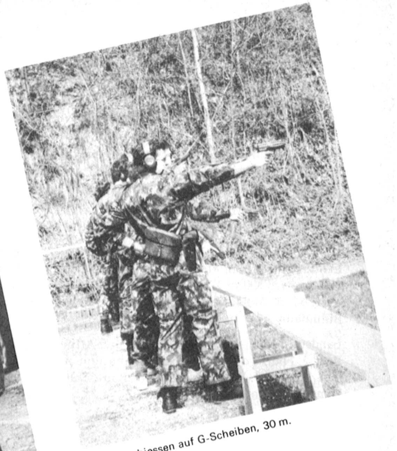
Pistolenschiessen auf G-Scheiben, 30 m.