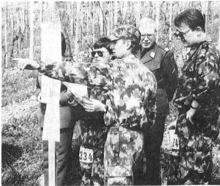
Distanzschätzen anhand von Geländeaufnahmen.