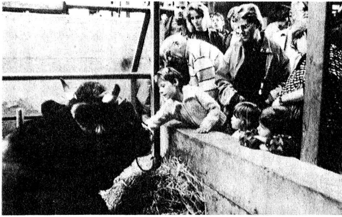
Einige Eindrücke aus der letztjährigen OLMA

Im OLMA-Stall stellen Züchter aus dem Gastkanton sowie Braunviehzüchter aus den Berggebieten der OLMA-Kantone ihre wertvollsten Zuchttiere aus.