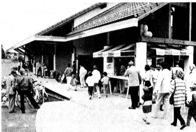
LANDI – Der Treffpunkt: Echtes Bindeglied zwischen bäuerlicher und nichtbäuerlicher Bevölkerung.