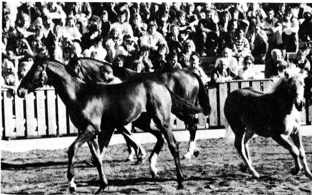
Tiervorführungen in der Arena.