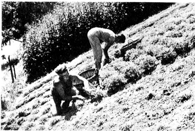
Biologischer Landbau. Ein Weg naturgerechter Landwirtschaft.