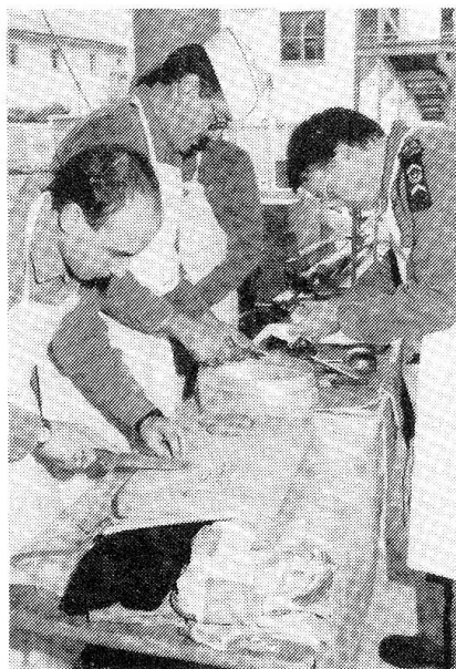
Gewissenhaft wurden die Zutaten gerüstet.

20 Franken zugestellt werden konnte. Die am Sonntagmorgen ebenfalls anwesenden EDV-Delegierten der Sektionen erhielten auf die meisten ihrer Fragen befriedigende Antworten, sodass der Wissensstand für die Supervision ihrer Kameraden absolut à jour ist. Allfällige Fehler – keine Veränderungswünsche – können weiterhin bis Frühling 1992 an Four Ruedi Anghern gemeldet werden. Ebenfalls bis zur DV '92 wird Büro-Center Waser in St. Gallen den Vertrieb des FOURPACK weiterführen und dann die Geschäfte an eine neue Vertriebsorganisation übergeben.