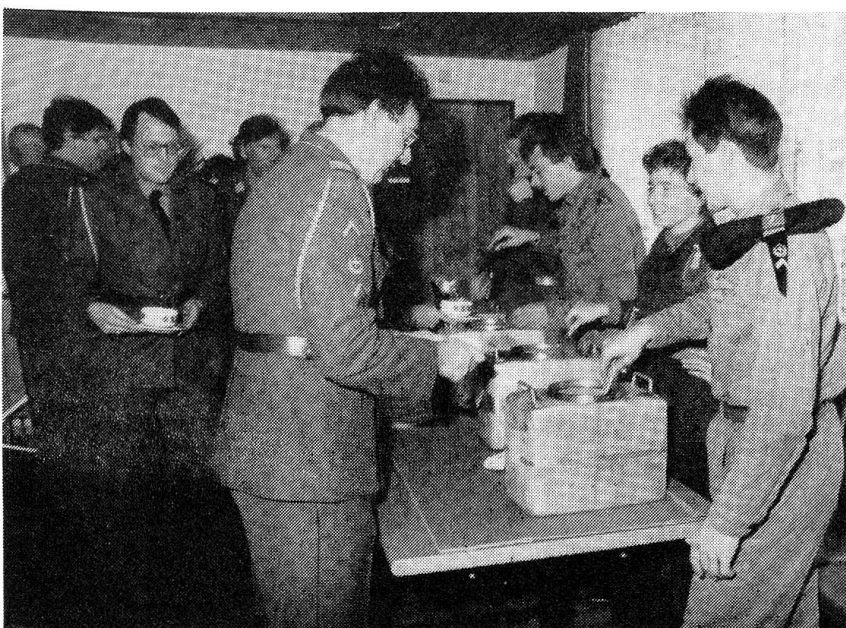
Die selber zubereitete Minestrone schmeckte allen vorzüglich.