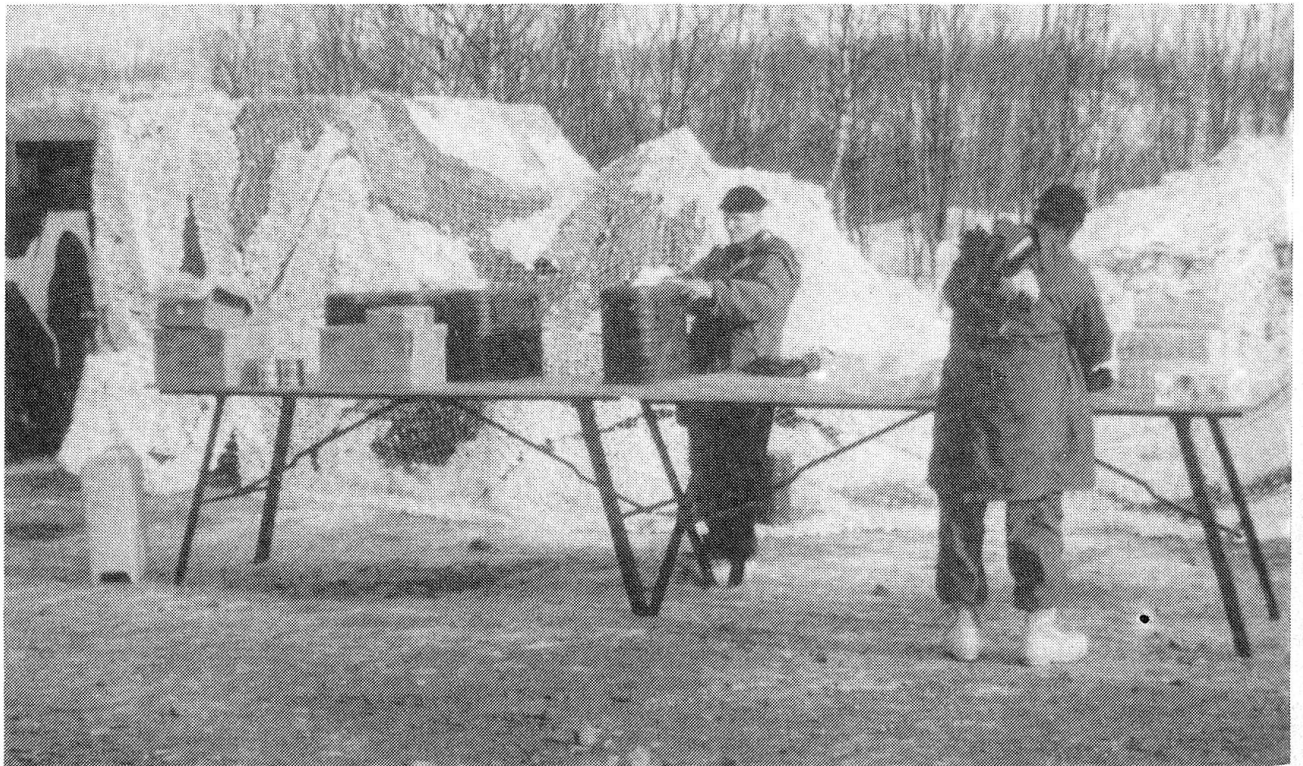
Bereitstellung von Verpflegung beim Manöver in Nordnorwegen

Die Amerikaner sind aus unterschiedlichen Gründen gezwungen, eine Reduzierung des internationalen Verantwortungsbereichs herbeizuführen und die Regierungen Westeuropas müssen nun wohl einen grösseren Teil der ungeliebten militärischen Bürde selbst übernehmen. Sehr schlecht sieht es dabei mit dem «Ist-Zustand» aus: Abgesehen von den Briten und Franzosen verfügt kein europäischer Staat über nennenswerte Verbände für Interventionen. Dagegen stehen den USA bewährte «schnelle Eingreifverbände» aller Teilstreitkräfte zur Verfügung. Neben den Luftlandverbänden ist es vor allem das elitäre