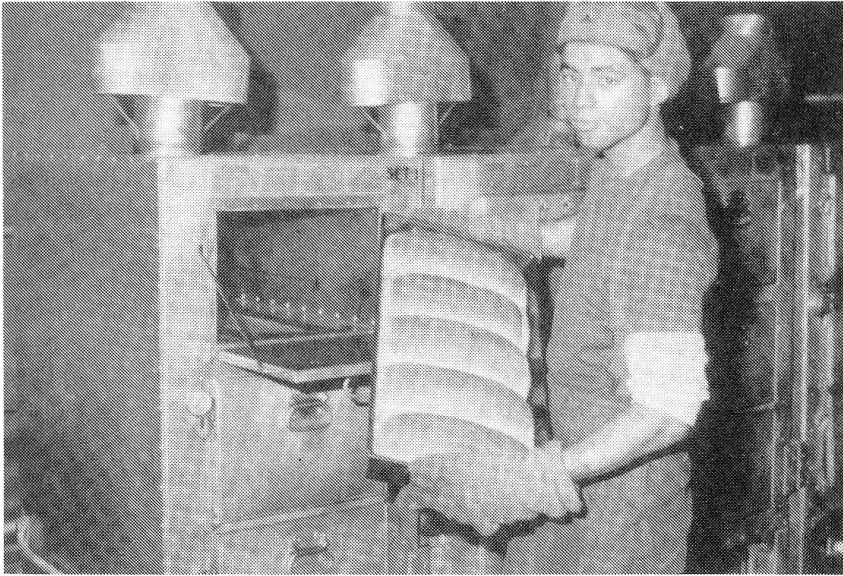
Das Brot ist fertig

«Ledernacken» gehört den speziell für Landungsunternehmen ausgebildeten und ausgerüsteten amphibischen Grossverbänden an, um die sich die fliegenden Verbände sowie Kampfunterstützungs- und als Versorgungskommando das «Marine Corps Supporting Establishment» gruppieren. Die Hauptkräfte sind als «Fleet Marine Forces» unmittelbar der