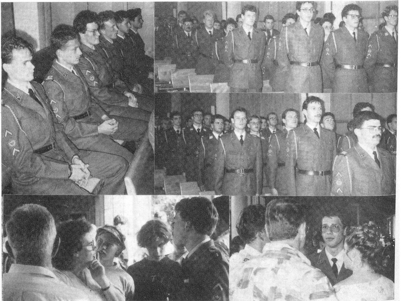
Impressionen von der Brevetierung der Fourierschule 2/92. Obere Reihe: Nun fehlt nur noch der Handschlag bis zur Brevetierung als frischgebackenen Fourier. Darnach (unten): Glücklich werden sie nach der erfolgten Beförderung von ihren Angehörigen und Freundinnen empfangen.

Heute seien nun alle Fourieranwärter in der Lage, ihre Funktion zu übernehmen. Er mahnte sie jedoch: «Kümmert euch um die Truppe und verpflegt sie gut!» Zugleich verabschiedete sich der Schulkommandant Fourierschulen,