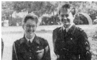
Gleiche Rechte für Mann und Frau: Diese beiden MFD-Fouriere hatten die gleichen Aufgaben zu lösen wie die männlichen Kollegen. Dazu Oberst Pillevuit: «Die beiden MFD-Fouriere verrichteten ihre Ausbildung bravourös.»