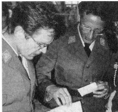
Diese beiden Klassenlehrer der Fourierschule 2/92 überprüfen gemeinsam noch die Eintragung im Dienstbüchlein.

Ab der kommenden Fourierschule 3/92 wird der bisherige Kommandant der UOS für Küchenchefs, Major i Gst Pierre-André Champendal, für die Ausbildung der Fouriere verantwortlich zeichnen. DER FOURIER wünscht ebenfalls ihm einen angenehmen Start und beglückwünscht ihn zu dieser Berufung. In einer der nächsten Ausgaben werden wir die Fourierschule näher vorstellen.