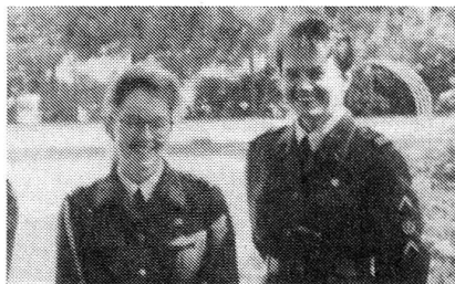
Gleiche Rechte für Mann und Frau: Diese beiden MFD-Fouriere hatten die gleichen Aufgaben zu lösen wie die männlichen Kollegen. Dazu Oberst Pillevuit: «Die beiden MFD-Fouriere verrichteten ihre Ausbildung bravourös.»