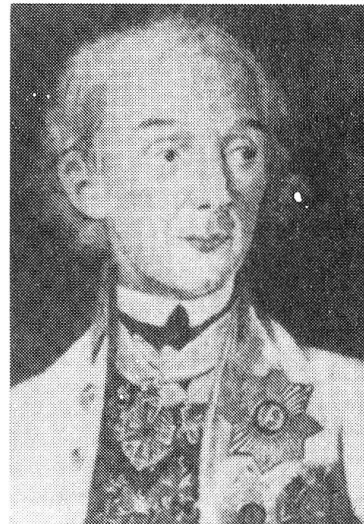
Unser Bild zeigt General Suworow.

jeden einzelnen Soldaten möglichst hoch gehalten werden. Dem Angriffsplan wurde auch ein Verpflegungsplan beigegeben. Dieser sah vor, dass der einzelne Soldat eine Verpflegungsration von drei Tagen auf sich trug und dass weitere Verpflegung für drei Tage auf den Maultieren nachgeführt wurde. Noch in Asti glaubte man, von Bellinzona aus am 21. September abmarschieren zu können, um Schwyz am 26. zu erreichen. Bei Einhaltung dieses Planes hätte man für die Etappe bis Schwyz eine Ration mehr als gerade notwendig mitgeführt. In Schwyz angelangt, war man der Meinung, durch Vermittlung der Generale Hotze und Korsakow Lebensmittel