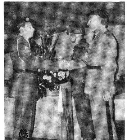
85 frischgebackene Rechnungsführer verliessen die Fourierschule 4/92.