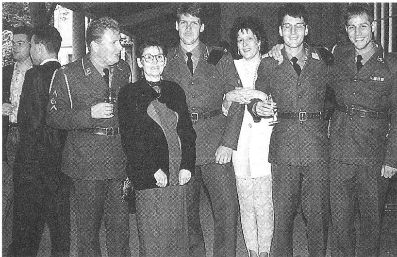
Eltern, Geschwister, Freundinnen und Freunde gratulieren zur Beförderung zum Rechnungsführer der Schweizer Armee.