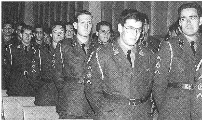
110 frischgebackene Fouriere sind nun für das Wohl der Truppe verantwortlich.

Als Chef und Führer erwarte man künftig von jedem einzelnen Fourier, dass er seine Aufgabe ernst nimmt. Zudem empfahl er den Rechnungsführern, sich unbedingt höhere Ziele zu setzen; dies werfe immer etwas Positives ab.