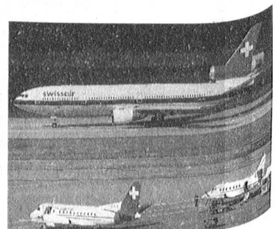
Auf Flughafenareal Zürich-Kloten (1993).

ma «Luftverkehr heute – eine Standortbestimmung»: Die Luftfahrt, so Heuberger, wurde mit dem Abkommen von Chicago vom 7. Dezember 1944 eine der reguliertesten Industrien. Doch der technologische Fortschritt hinsichtlich Effizienz, billigeren Preisen und Sicherheit brachten den Weltluftverkehr in den letzten paar Jahren in eine schwierige Lage. Die Gründe dafür waren die wirtschaftliche Rezession in allen Regionen, der Verdrängungswettbewerb mit Überkapazitäten/Dumpingpreisen, die Kapazitätsengpässe in der Luft und am Boden sowie ökologische Probleme. Die Konsequenzen daraus für die Fluggesellschaften waren Kostenreduktionen wegen Betriebsverlusten, Zusammenarbeit, Abkommen in Teilbereichen (Marketing, Technik) Allianzen (Global Excellence [Swissair-Delta-Singar-