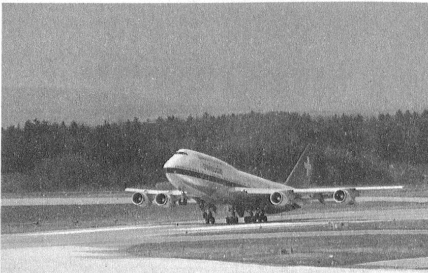
Startender Jumbo-Jet (Flughafen Zürich-Kloten).

Als eine reelle Möglichkeit für den «Markt Europa» könnte sich G. Heuberger ein Projekt ALCAZAR LIGHT vorstellen. Dabei würde man vorläufig von einer Fusion und der Teilnahme der KLM an dieser Allianz absehen. Der interne Widerstand dagegen aus finanziellen Gründen und der externe Druck der Konkurrenz könnten wahrscheinlich auf diese Weise in Grenzen gehalten werden.