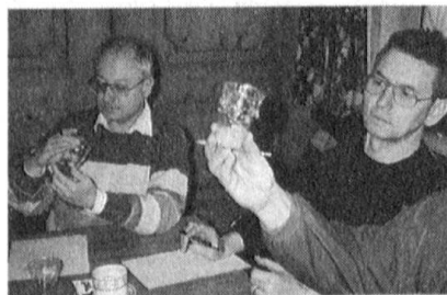
Muskatnuss oder Schleifstaub?

Angesagt war im Anschluss daran auch ein fachtechnischer Teil, in dem es darum ging, Kräuter, Pulver verschiedener Arten und andere «Kreationen» zu bestimmen. Hier unterscheiden sich Fouriere offenbar von Praktikern. Thymian ist nicht gleichzusetzen mit «Heublumen» und Muskatnuss hat wenig gemeinsam mit «Schleifstaub». Neben fachtechnischen Erkenntnissen trug dieser Anlass auch zu etwelcher Erheiterung bei.