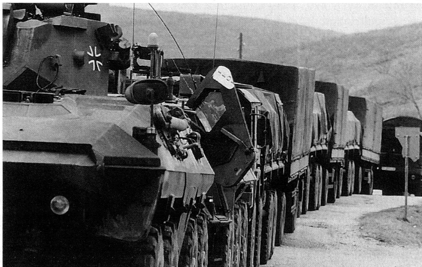
Soldaten des Transportbataillons GECONIFOR (L) fahren in einem gesicherten Konvoi Ersatzteile sowie Einzel- und Mengenverbrauchsgüter von Splitt über Kamensko (Grenze zwischen Kroatien und der Moslemisch-Kroatischen Föderation, Duvno, Kupres (Britischer Versorgungspunkt) nach Siporo (Britischer Versorgungspunkt). Im Bild: Technischer Halt vor der Grenze.

Eine gesunde und gute Verpflegung nimmt gerade bei im Ausland tätigen Soldaten einen hohen Stellenwert ein. Obwohl es sich um einen kriegsnahen Einsatz handelt, treten im Vergleich zum Truppenalltag in der Heimat keine Probleme auf. Da die Versorgungslage in Jugoslawien durch die Kriegswirren noch schwierig ist, wird ein Grossteil der Güter aus Deutschland eingeflogern und vor Ort von Fachkräften in der üblichen Weise verarbeitet. Es ergeben sich praktisch keine Unterschiede zwischen den Angeboten in den deutschen Kasernen und während des Bundeswehralltags in Kroatien. Neben dem üblichen Verpflegungsangebot, für Zeit- und Berufssoldaten freiwillig und gegen Bezahlung, für die wenigen Wehrpflichtigen und die Reservisten teilweise Pflicht und kostenlos, gibt es aber auch Ergän-