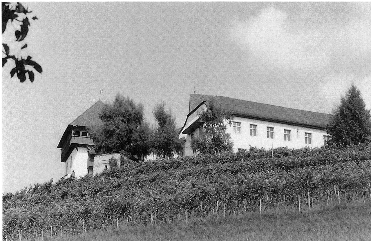
Bereits bei der ehemaligen Johanniterkommende Hohenrain wurden Rebgrarten angelegt. Seit 1975 wird hier der «Johanniter» der Landwirtschafts- und Maschinenschule Hohenrain gewonnen.

tig angemeldet werden, um noch zu einer der rund 100 000 Liter Luzerner Weine zu gelangen.