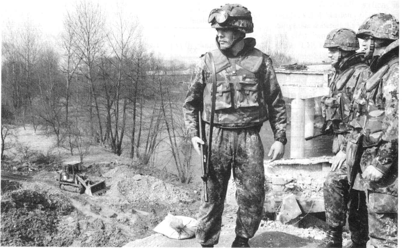
Soldaten des Pionierbataillons GECONIFOR (L) reparieren die schwer beschädigte Brücke über die Bosna bei der Ortschaft Visoko, welche rund 20 km nordwestlich von Sarajewo liegt. Im Bild: Pioniere auf der Auffahrt zur Brücke. Im Hintergrund die zerstörte Brücke.

panzer LEOPARD 2 verzichtet, da man Provokationen und Skatationen unbedingt vermeiden möchte. So musste ein Teil der Panzerbesatzungen des Panzeraufklärungsbataillons 12 extra auf den leichten Radpanzer LUCHS umgeschult werden.