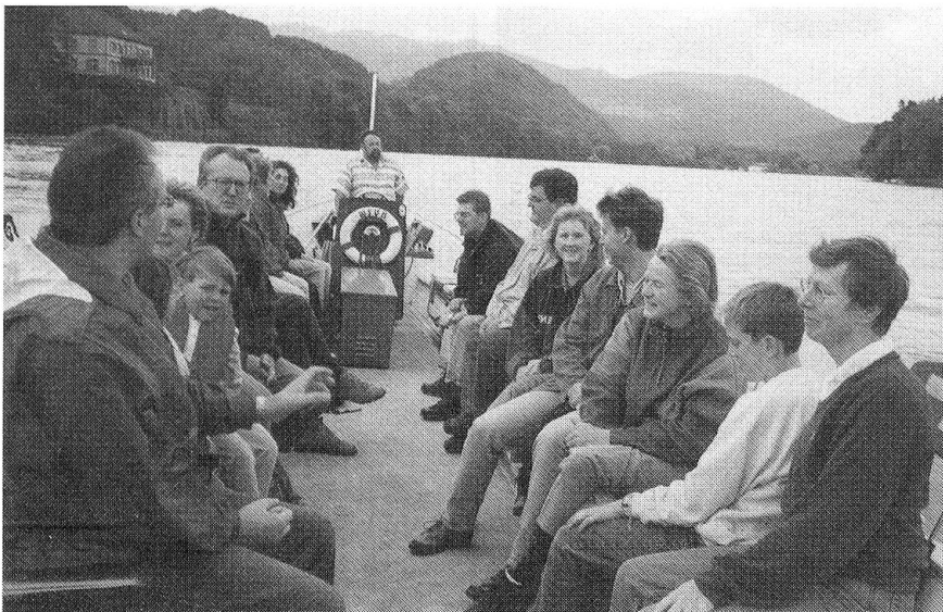
19 Personen nahmen am Familienanlass vom 29. Juni teil.

5. September Bärenstamm ab 20 Uhr «Schmiedstube» Zofingen