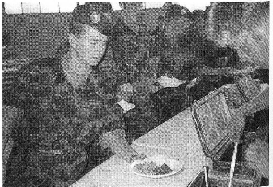
Am Samstag Mittag: Nach dem Wettkampf gab's ein Rindsragout, Kartoffelstock mit Erbsli und Rüebli. «Bitte noch ein bisschen Sauce für's Seeli» wünschte sich dieser Teilnehmer und wurde bestens bedient.