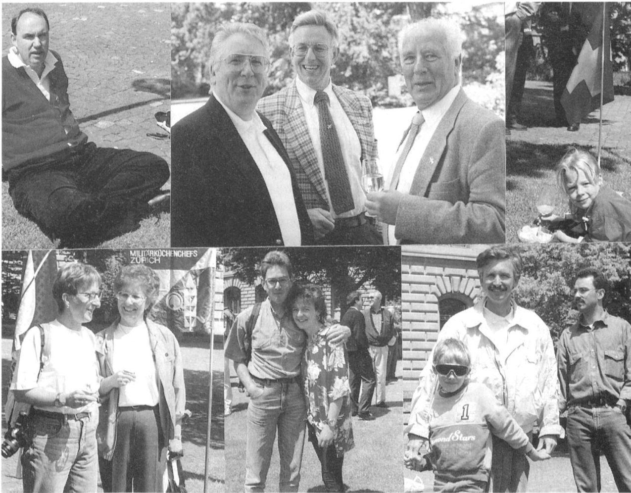
Die Kundgebung vom 22. Mai 1993 in Bern geht in die Geschichte des Schweizerischen Fourierverbandes ein. 200 Hellgrüne mit Anhang folgten dem Aufruf, an der machtvollen Demonstration gegen die beiden Armee-Abschaffungs-Initiativen teilzunehmen. Für die meisten Küchenchefs, Fouriere, Quartiermeister und die anderen Anwesenden war es die erste Kundgebung im Leben, an der sie sich beteiligten.