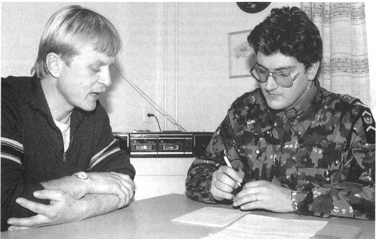
Der Fourier ist der direkte Ansprechpartner zwischen der Zivilbevölkerung und der Armee.