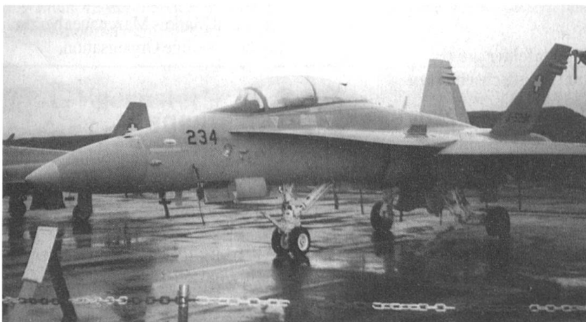
Das diesjährige Jahresprogramm der Sektion Zentralschweiz des Schweizerischen Fourierverbandes sieht auch eine Besichtigung der Flugzeugwerke und des F/A-18-Flugzeuges in Emmen vor.

Der Mitgliederschwund, die abgeblasenen Anlässe im auslaufenden Tätigkeitsprogramm.