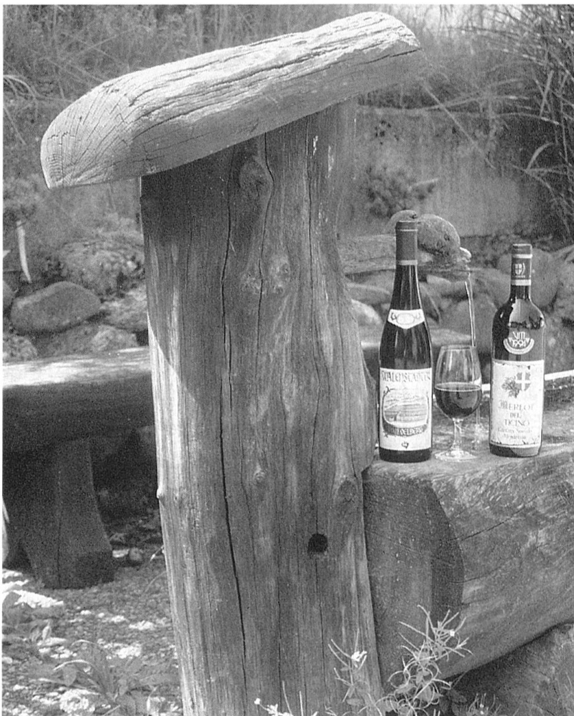
Wein ist ein Naturprodukt und als solches gut.