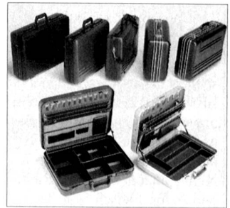
Der Allzweckkoffer von Prevent.

Wenn vorhanden, mit grünem Salat servieren. Auch Salzkartoffeln eignen sich als Zugabe.