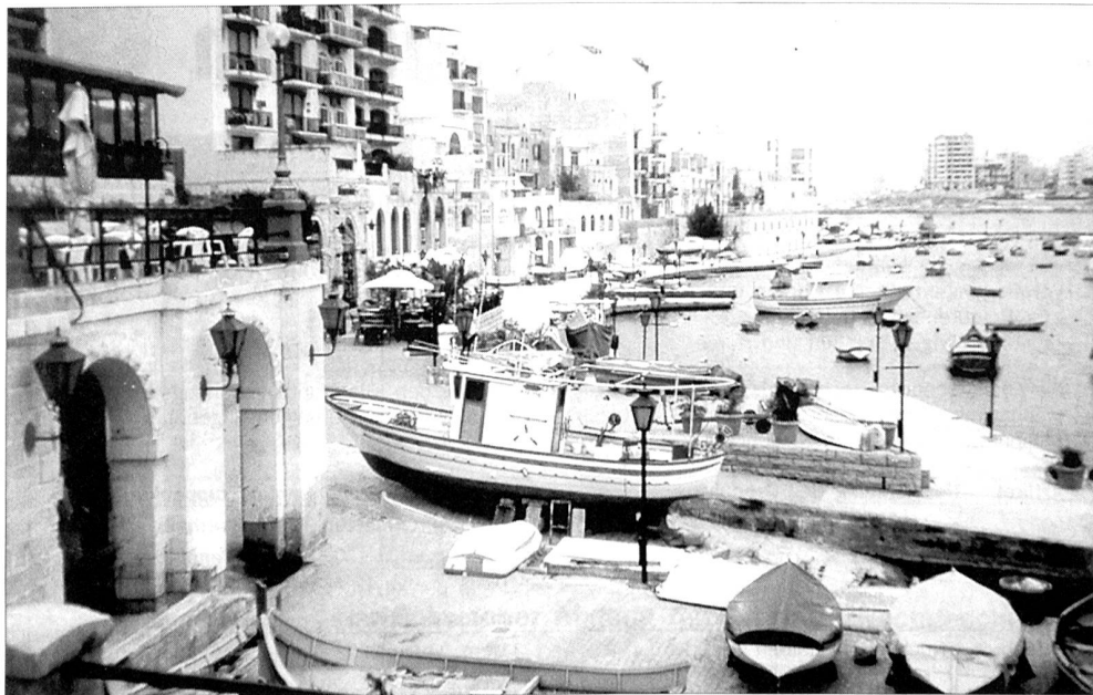
Gelassenheit und Ruhe sind besonders typisch für die Inselwelt Maltas. Sie stand von 1800 bis 1964 unter britischer Herrschaft und ist erst seit 1979 frei von britischen Truppen.

IM DEZEMBER 1942 ... liefen vier Konvois ohne Verluste in den Hafen Maltas ein. Allein in diesem Monat wurden an die 200 000 Tonnen Güter aller Art an Land gebracht. Doch dauerte es lange, bis die durch Mangel an Nahrung und Wohnmöglichkeiten geschwächten Menschen allgemein wieder zu Kräften kamen. Die Auswirkungen der Unterernährung und die damit einhergehenden Krankheiten wurden weiter durch eine schwere Poliomyelitis-Epidemie im November 1942 verschärft, die erst Anfang Juni des folgenden Jahres ihr Ende nahm.