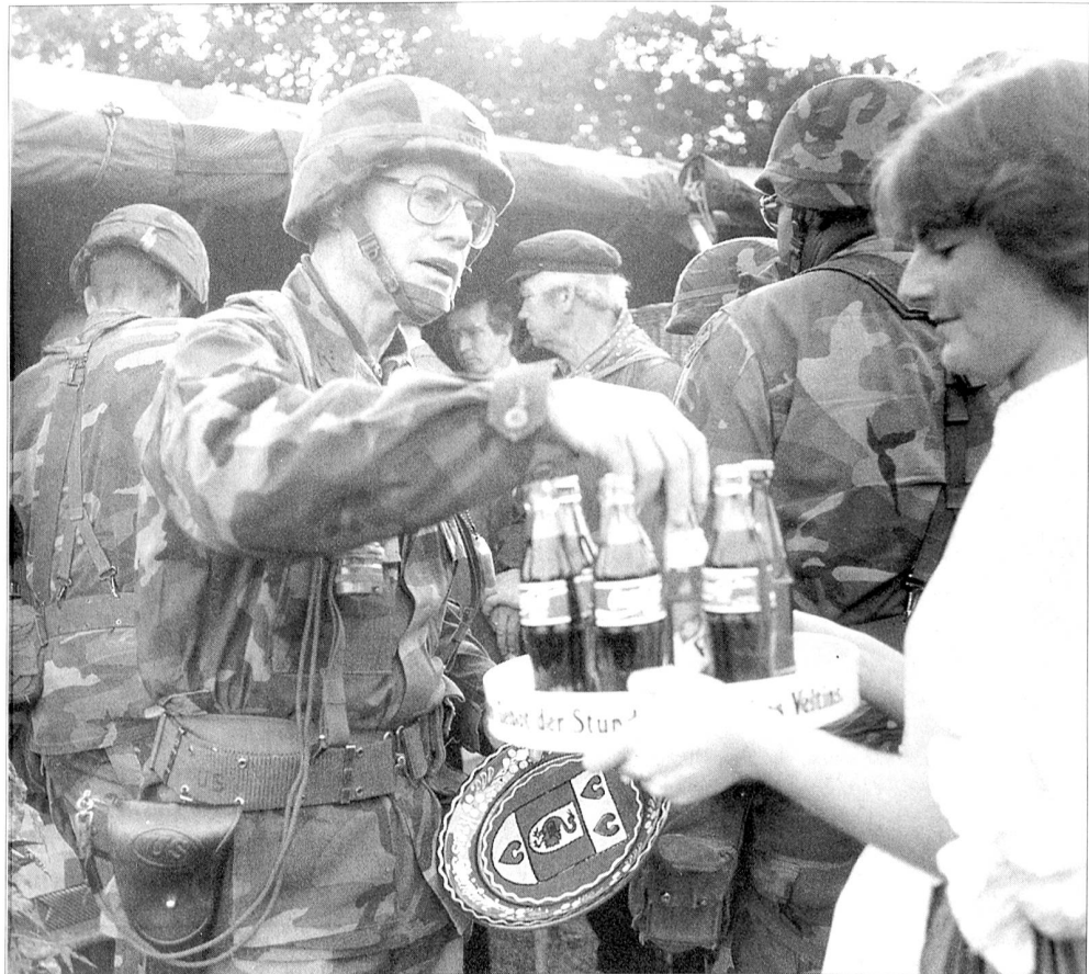
Reforgertruppen werden in Deutschland mit dem US-Nationalgetränk Coca-Cola versorgt.

Seither sind viele Jahre vergangen. Auch bei der US Army hat sich manches geändert, verbessert und verschlechtert. Die C-Rationen sind längst Geschichte und heute herrschen diese schweren, nahrhaften, aber wenig schmackhaften MRE-Mahlzeiten vor. In braunem Plastik sind die getrockneten Mahlzeiten wie Hafergrütle, Fertigmüsli, Stärke und verschiedensten Pülverchen verpackt. Der wenig schmackhafte Inhalt hat zwar einen hohen Brennwert von über 3000 Kalorien, wird aber von den Soldaten oftmals verachtet. Sie werfen die Nahrungsmittel teilweise weg oder verschenken sie bei Manövern an