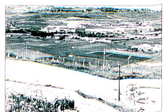
Die Aussenbefestigung von Fort Mosta.