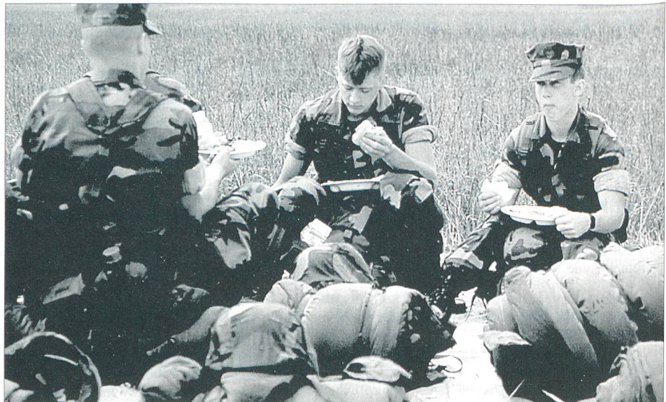
Marines beim Frühstück während einer Übungspause.