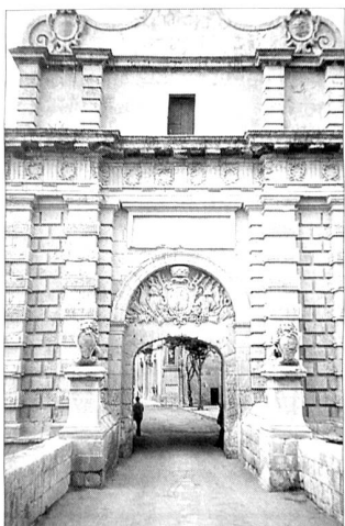
Ein Durchgang in der Stadt Mdina, eine Stadt wie im Märchenbuch.

Die Kathedralen und Kirchen sind im katholischen Malta mit den Schwesterinseln Gozo und Comino nicht wegzudenken. So sind denn auch für die Malteser «3 F» lebenswichtig (Festa, Fahnen, Feuerwerk). Alle Besucher sind jeweils gefesselt vom Anblick des Bodens der St. Johns Co-Cathedral in Valletta. 375 Grabplatten auf kunstvollste mit Intarsienarbeiten in allen erdenklichen Farben des Marmors verziert, sind wie eine Gemäldegalerie im Boden eingelassen. Übrigens: Immerhin verfügen die Malteser über 365 Kirchen – für jeden Tag des Jahres ein Gotteshaus.