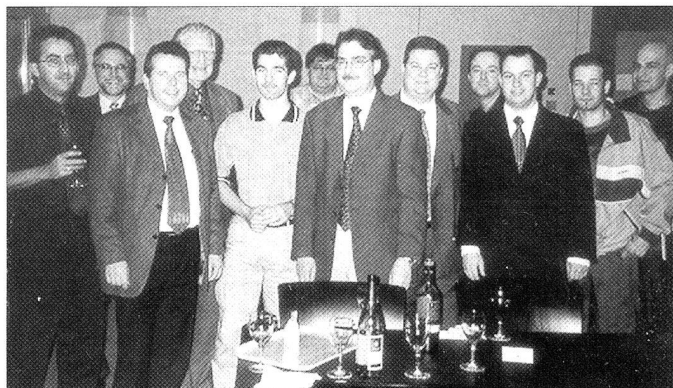
Einige Mitglieder der Zeitungskommission Armee-Logistik anlässlich des von der SUVA offerierten Aperitifs.

Coupon einsenden an: ARMEE-LOGISTIK, Postfach 2840, 6002 Luzern – E-Mail: mas-lu@bluewin.ch