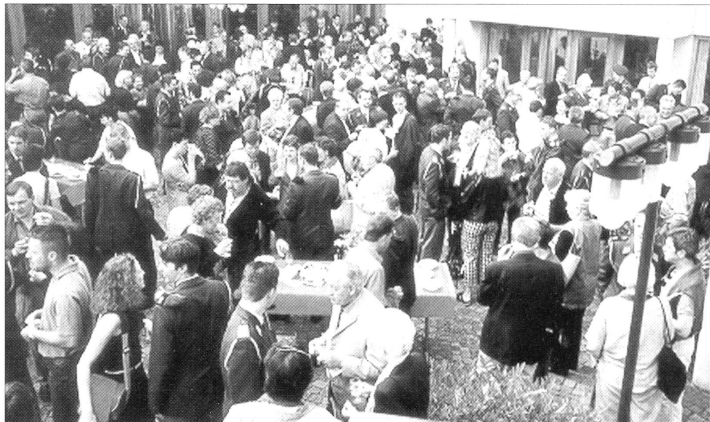
Grosser Bahnhof nach der Beförderungsfest der Fourrierschule 1/01 auf dem Vorplatz des Lötschbergsaals in Spiez.

Le Comité romand félicite les 87 nouveaux fourriers et leur souhaite plein succès pour leur paiement de galons et leur future carrière militaire.