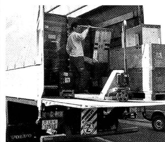
Feierabend ist erst wenn das zurückgenommene Leergut auch wieder im Logistikzentrum abgeladen ist.