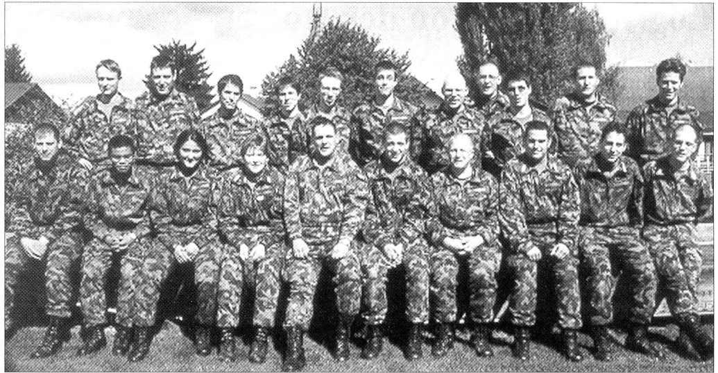
22 AdA aus der ganzen Schweiz absolvieren die Qm-Ausbildung an der Log OS 2/01.

Erst seit dem Jahre 1962, sieben Jahre nach der Gründung der Bundeswehr, gibt es Schutzvorschriften.