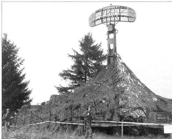
Viele deutsche Radar-Soldaten sind krebskrank oder verstorben.

Nachdem die Besatzung fluchtartig den Kampfpanzer verlassen hatte, wurde das Gelände weiträumig abgesperrt. Selbst die zur Hilfe eilende deutsche Feuerwehr wurde sofort weggeschickt. In sicherer Entfernung warteten Soldaten und Feuerwehr, bis die Granaten detoniert waren und das Feuer erlosch. Nach Angaben der US-Armee wurde aber bei dem Feuer die Ummantelung der Munition nicht beschädigt und keine Radioaktivität freigesetzt. Bei dieser Gelegenheit erfuhr die Bevölkerung rein zufällig, dass die US-Truppen in Europa in der Zeit des «Kalten Krieges» auch bei Manövern und sonstigen Diensten immer einen Alarmvorrat an scharfer Munition mitführten. Dies war aus Gründen der Bereitschaft für den Fall eines Überraschungsangriffes aus dem Osten erforderlich.