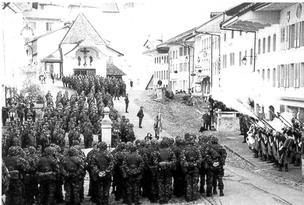
Den einzigen nostalgischen Anstrich erlebten die Angehörigen des Vsg Bat 121 an der Standartenabgabe in Gruyères mit der Teilnahme der Fribourger Kanonieren.