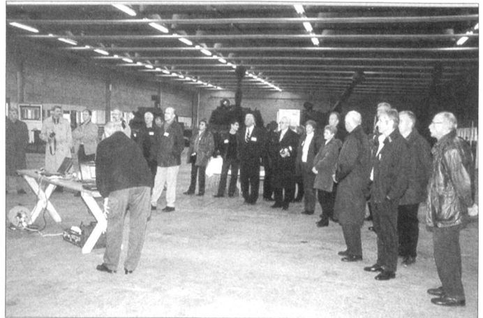
Zum 20. Barbaratag erschienen nicht etwa nur Medienleute, sondern Partner und spezielle Gäste aus dem In- und Ausland.

Der Wartungsbereich der seit vergangenem 1. April insolventen Fairchild Dornier GmbH (FD) in Oberpfaffenhofen bei München erzielte 2001 mit 400 Beschäftigten rund 80 Millionen Franken Umsatz. Der Komponentenbereich ist hauptsächlich mit dem Zusammenbau grosser Baugruppen für Flugzeuge der Airbus-Familie beschäftigt und kam letztes Jahr mit rund 300 Angestellten auf 72 Millionen Franken Umsatz.