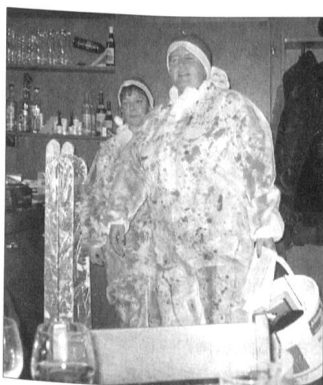
(W.H.) Zum Jahresschlusshöck fanden sich 27 Personen im «Raben» in Gachnang ein. Mit einem von der Landi Gachnang gespendeten Apéritif begann ein

abwechslungsreicher Abend, gekrönt von einem ausgezeichnet mündenden Nachtessen.