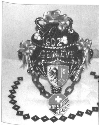
La fameuse marmite en chocolat.