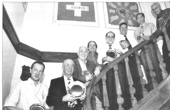
Les membres du Bureau Romand 1998-2002.

Les membres de l'ARFS nés en 1976 et après qui prennent part au au tir de l'AG reçoivent une indemnité d'encouragement de frs. 20.- à encaisser directement lors du retrait des feuilles de stand.