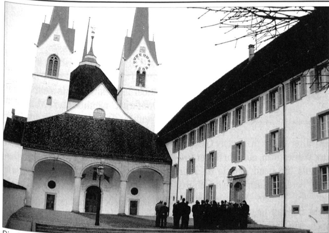
Die imposante Klosterkirche von Muri AG.