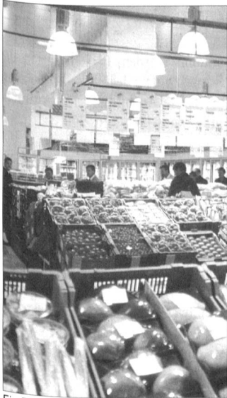
Ein Blick in den begehrten Kühlbereich, den so genannten «Cool Way».

malen Lagerhaltungsbedingungen und die Einhaltung der Kühlkette garantiert eine einwandfreie Qualität der Produkte.