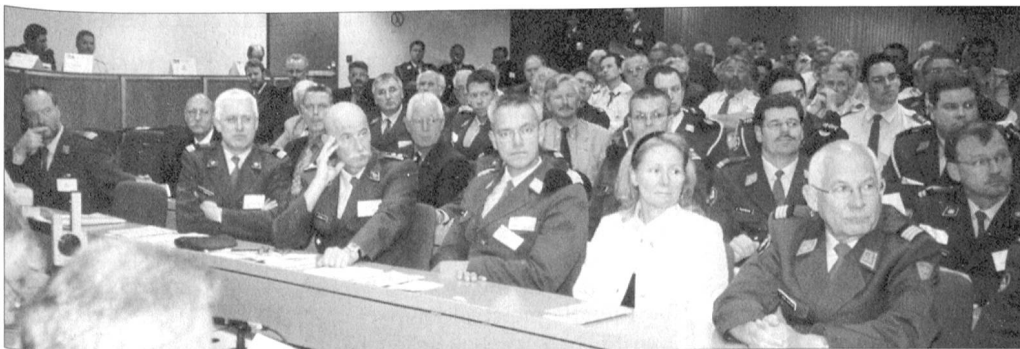
Die Tagung fand im modern eingerichteten Conference Center der SWISS statt.