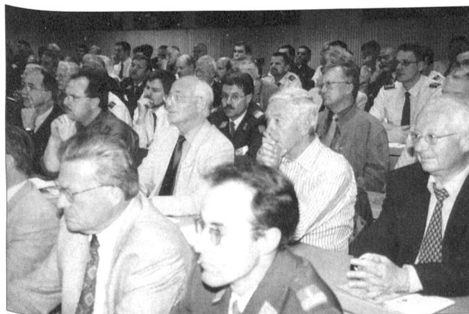
Die Mitglieder des Schweizerischen Fourierverbandes (SFV) und des Verbands Schweizerischer Militärkitchenchefs (VSMK) tagten wahrscheinlich zum letzten Mal gemeinsam. Nächstes Jahr sollen die geschäftlichen Verhandlungen getrennt jedoch das Rahmenprogramm zusammen gestaltet werden. Übrigens: Die DV 2004 findet im «Albisgüetli» in Zürich statt.

aufzeigen, welche Konsequenzen das auf die Erfüllung unserer Aufgaben hat», sagte der Generalstabschef. So sei bereits heute absehbar, dass die Armee XXI nur mit Einschränkungen umgesetzt werden könne. Diese manifestiere sich primär in der Ausbildung: Mehrere Lehrverbände können nicht mit dem Ausbildungsmodell A XXI starten. Der Aufwuchs des Militärpersonals in der Ausbildung könne nicht wie geplant erfolgen. Die angestrebte Professionalisierung in der Ausbildung werde verwässert.