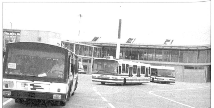
Bevor es mit modernen Befrdigungsmitteln auf die ausgiebige Flughafenbesichtigung ging ...

Vor 40 Jahren war der Besuch von Uniformierten auf dem EuroAirport Basel-Mulhouse-Freiburg noch verboten. Am vergangenen 17. Mai musste lediglich fr die Besichtigung der Anlage und des Ausbauprojektes jedermann einen gltigen Personalausweis auf sich tragen. Die Delegierten in Uniform trugen am Waffenrock zusatzlich das Schweizer Abzeichen. So war es nicht verwunderlich, dass sich Delegierte und Gaste am aussergewhnlichen Tagungsort regelrecht verwhnen liessen.