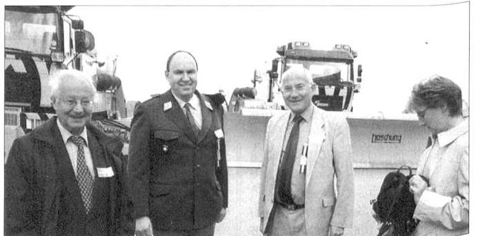
... vorher musste die Einstellhalle mit Winterdienst-Fahrzeugen des Flughafens ins Freie geraumt werden (im Hintergrund).