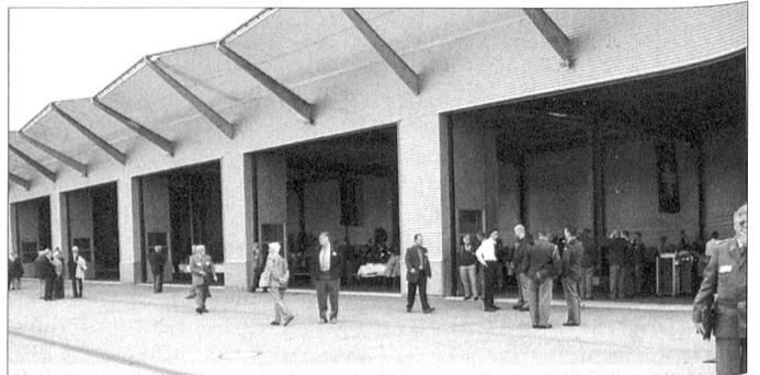
... wurde in dieser Halle das Mittagessen (Original-Flugzeug-Kost) verpflegt, aber ...