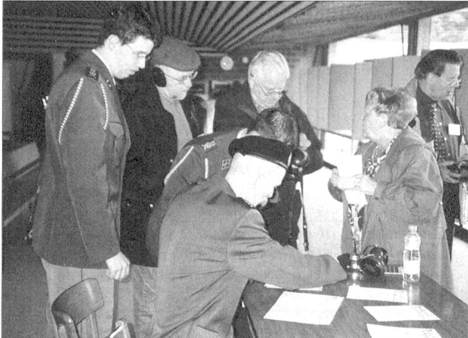
Das Delegiertenschiessen ging minutios ber die Bhne.