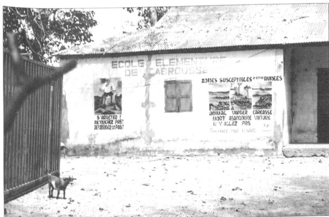
Le bureau du Directeur à l'extrémité des classes, à gauche un container servant de cantine.

veaux, m'ont immédiatement reconnu. Après avoir discuté quelques instants dans le préau, l'un d'entre eux m'a conduit à la bibliothèque où travaille l'épouse du Sous-préfet qui est enseignante à mi-temps et responsable de la bibliothèque pour l'autre mi-temps.