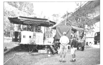
Die neue Feldküche hat sich bestens bewährt.

versuchte sich zuerst mit dem Mikrofon, stieg aber wegen Technischen Problemen auf die unverstärkte Variante um. Er lud die rund 300 geladenen Gäste in die angrenzende Ausstellung ein. Der Apéro wurde durch das Geknalle aus einer Artilleriekanone unterbrochen und mit dem Armeespiel der Feld Div 5 umrandet.