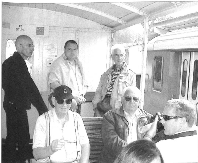
Nicht immer ist eine Bahnfahrt so lustig und schön...