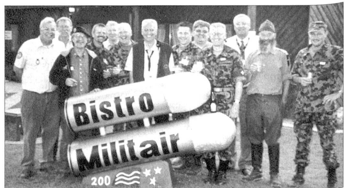
Allseits zufriedene Gesichter bei der Leitung des Moduls Armee nach vier anstrengenden Tagen.

Beachten Sie bitte dazu ebenfalls die weiteren Beiträge auf Seite 18 in dieser Ausgabe von ARMEE-LOGISTIK!