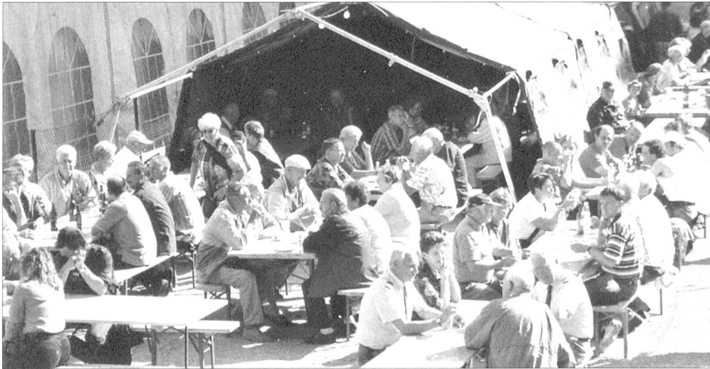
Stets guter Publikumsaufmarsch.