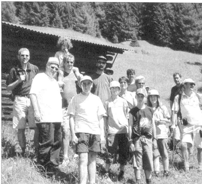
Aus der Pilzexkursion wurde nichts. Dafür erlebten die Fouriere Mittelbündens einen aussergewöhnlichen Waldspaziergang in Creusen.

Im herrlichen Spätsommerwetter liess sich diese Supermahlzeit mitten in der Region Mittelbünden geniessen.