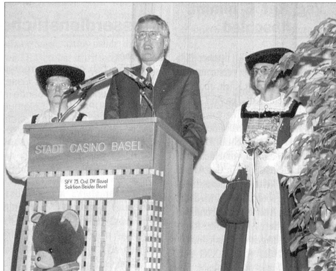
Bundesrat Villiger schreibt (vorläufig noch) Geschichte des Schweizerischen Fourierverbandes. Er ist nämlich der letzte Bundesrat, der einen Anlass des Gradverbandes besuchte. Es war anlässlich der 75. Jubiläumsdelegiertenversammlung in Basel.

LUZERN – r. Bereits abgeschafft hat der Kanton Bern die Funktion des Sektionschefs (Armee-Logistik berichtete darüber). Der Kanton Luzern sieht ebenfalls eine Umstellung vor. Die Regierung hat allerdings noch keinen konkreten Entschluss gefasst. An der Generalversammlung des Vereins Luzerner Sektionschefs prognostizierte Präsident Beat Krieger aber eine Veränderung ab dem Jahr 2005. Aber: Die sich abzeichnende Wegrationalisierung der Sektionschefs schüre die Unsicherheit unter den Betroffenen.