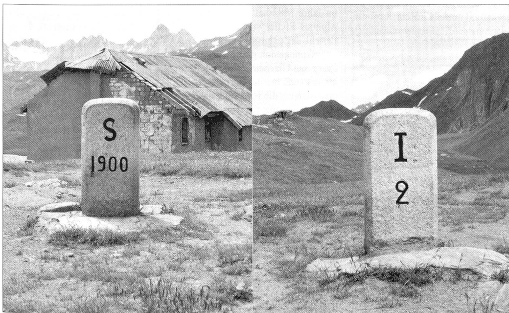
Grenzstein Seite Schweiz (S 1900) mit Sicht nach Italien (links) und Grenzstein Seite Italien (I 2) mit Sicht in die Schweiz.

In Italien gelangen 1922 die Faschisten an die Macht und in der Folge entwickelt Mussolini überall eine monumentale Bautätigkeit. Am 15. August 1929 wird auf der italienischen Seite eine Fahrstrasse (für Lastwagen befahrbare «Touristenstrasse») von Domodossola bis zur Passhöhe des San Giacomo eröffnet. Aus diesem Grund wird dem neutralgischen Punkt an der Südfront wieder mehr Aufmerksamkeit geschenkt. 1935 bis 1936 erfolgt der Bau einer Seilbahn von All'Acqua zum Pian San Giacomo, eines Blockhauses, von elf Unterständen für schwere und leichte Maschinengewehre, sowie von offenen Geschützständen für 8,4 cm Kanonen (ausgeführt bis 1939). 1937