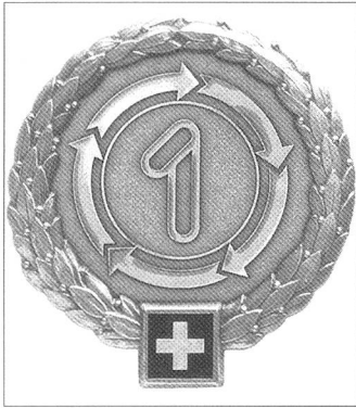
Am Rande notiert