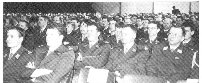
Soweit das Auge reicht, waren die Plätze in der Luga-Halle auf der Luzerner Allmend besetzt.

Insgesamt umfasst die Log Br 1 mit dem üblichen Zusatzbestand an die 13 500 Angehörige der Armee.