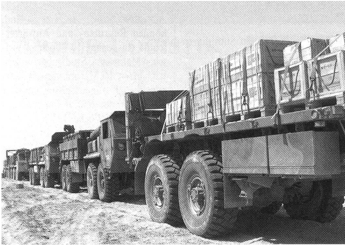
Der 500-seitige Militärbericht macht die Nachschubprobleme sichtbar, basiert auf 2300 Einzelgesprächen, 68 000 Fotos und fast 120 000 Dokumenten.