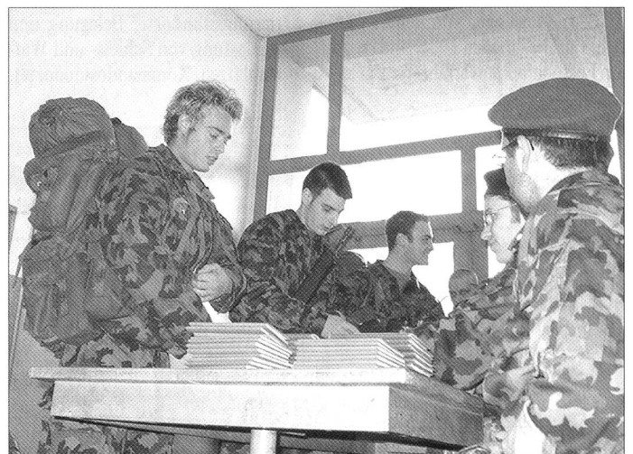
Bereits am 2. Februar rückten die ersten Wehrmänner zur Nachschub/Rückschub Schule 45 in Fribourg ein (unser Bild). Pro Jahr erlernen hier nebst Technischen Lehrgängen unter anderem rund 80 Uof, 50 Of-Anwärter und je RS 210 Soldaten ihr Handwerk.