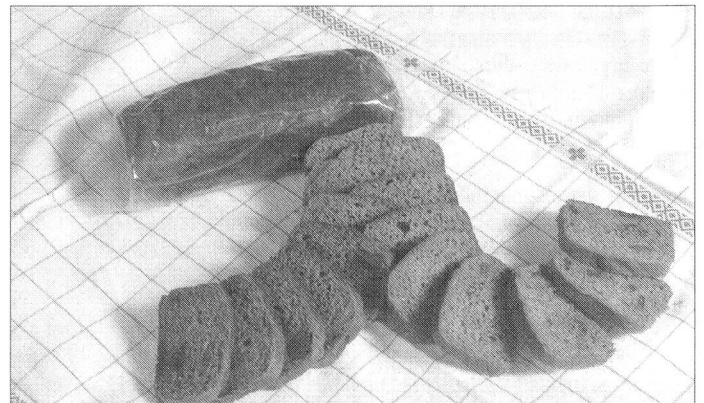
Besondere Schweizer Armee-Geschichte schrieben das Original-«Frischhaltebrot» (oben) und das «Früchtbrot» (unten im Bild).