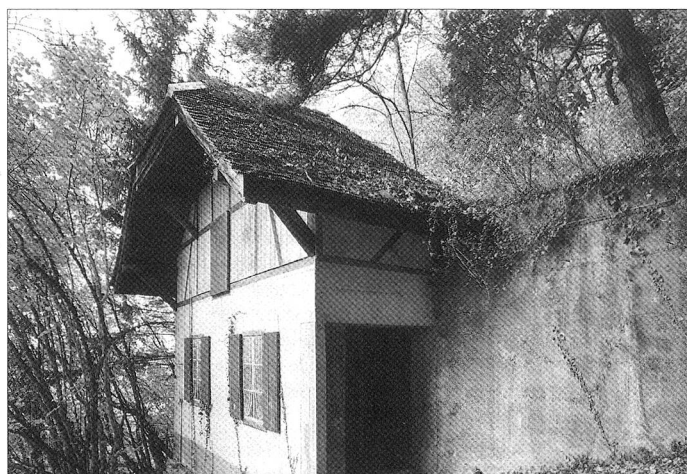
Infanteriebunker, Gampelen BE; Chalet, ca. 1940.