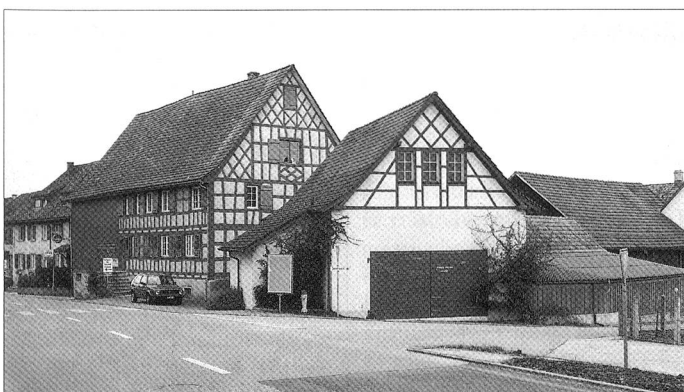
Infanteriebunker im Ortskern von Triboltingen, TG; Maschinenscheune, 1938.

Für die Wahl der Tarnmotive gilt also die Schweiz, so wie sie ist. Nicht so, wie sie dargestellt wird. Uns ist die Schweiz als Landschaft, ob als Berggebiet oder Mittelland, von unzähligen Postkarten und Kalenderbildern bestens vertraut. Gerne wird die Schweizer Landschaft als Idylle präsentiert.