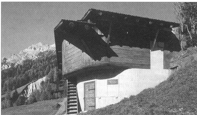
Beobachtungsbunker, Sufers, GR; Stall, 1937.