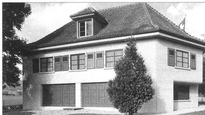
Infanteriebunker, Gländ, VD; «Villa rose»), 1940.

Die grosse Zahl der falschen Chalets und ihre verschiedenen Standorte sind ein Abbild der engen Verflechtungen zwischen der zivilen und der militärischen Schweiz. Die Bauten des Militärs sind über die gesamte Schweiz verteilt. Einsame Barackenbauten am Waldrand oder ein eingezäuntes Depot im Gelände leiten schnell den militärischen Verwendungszweck her. Scheinbar zufällig stehen diese Bauten in der Umgebung. Ihre Lage verrät keine strate-