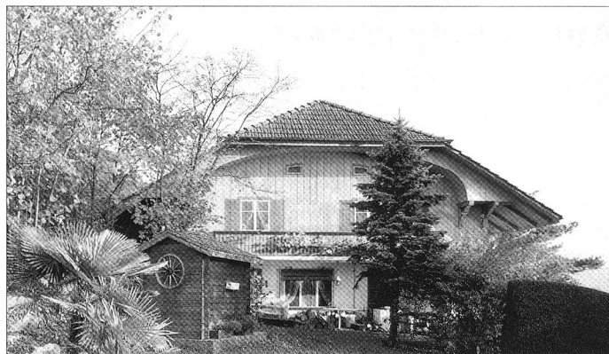
Infanteriebunker, Hilterfingen BE; Chalet, 1941.

Die Haustarnungen des Militärs sind voll von Ironie. Sie paraphrasieren scheinbar regionale Baustile und ländliches Bauen. Basteleien und raffinierte Tricks finden Anwendung, bis der getarnte Bunker täuschend echt in der Landschaft steht. Immer orientiert sich die Wahl der Tarnmotive an einer anonymen Bautradition. Hütten eignen sich besser als Paläste. Sind die falschen Chalets also Prototypen eines heutigen Schweizerhauses?