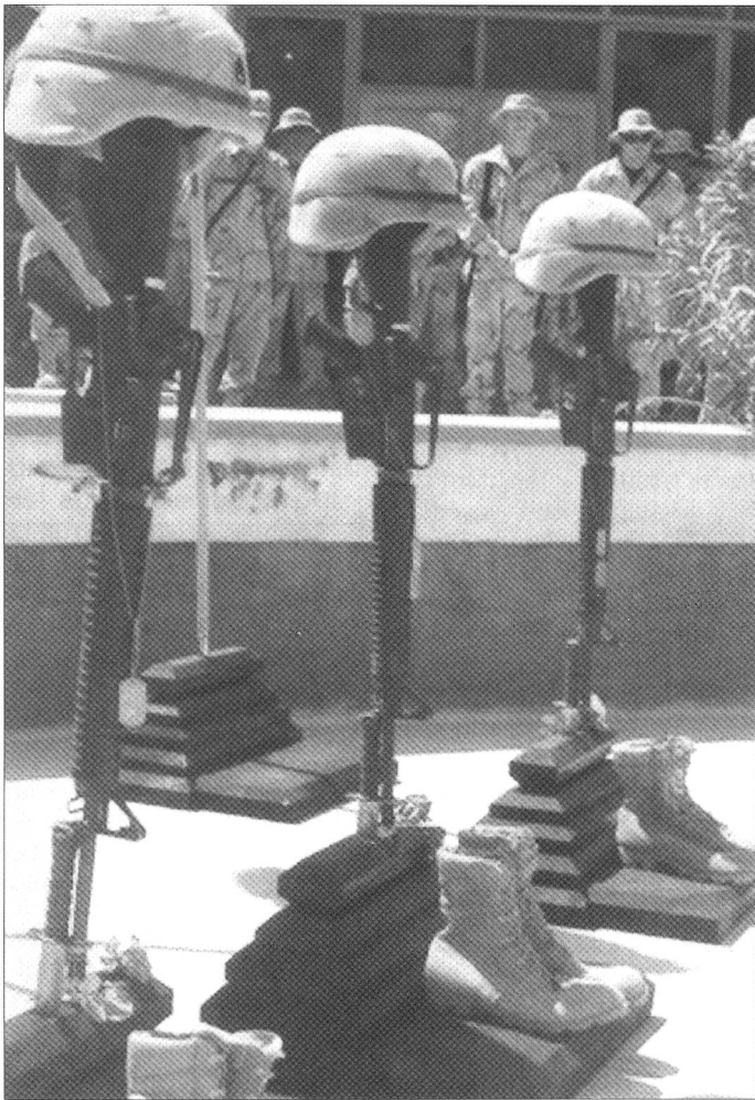
US-Soldaten gedenken ihrer Gefallenen.

sowie ein Armee-Geistlicher jeden Gefallenen, trägt den mit einer US-Flagge versehenen Sarg aus dem Transportflugzeug in einen Leichenwagen und übernimmt den Abtransport.