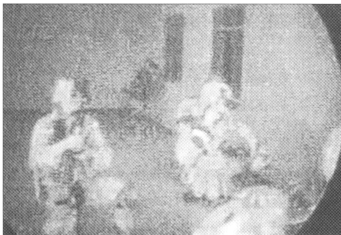
Nachteinsätze zehren besonders an den Nerven der GIs.