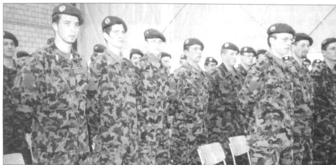
In der Halle O auf dem Waffenplatz Thun wurden neun Romands, ein Tessiner und 57 Deutschschweizer des Küchenchef-Lehrganges 3/05 zu Obergefreiten befördert.