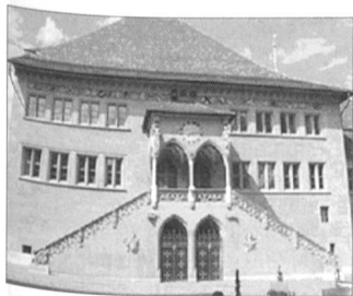
Bern – Rathaus

Das Rathaus ist das politische Zentrum von Stadt und Kanton Bern. In diesem 1406 bis 1416 von Heinrich von Gegenbach erbauten spätgotischen Gebäude versammeln sich die 200 Mitglieder des bernischen Grossen Rates während fünf jährlichen Sessions zu öffentlichen Verhandlungen. Das Rathaus ist der offizielle Sitz der bernischen Kantonsregierung. Am Donnerstag tagt die Legislative der Stadt Bern, der Berner Stadtrat. Auch die Synode, das Parlament der evangelisch-reformierten Kirche des Kantons Bern tagt im Rathaus.