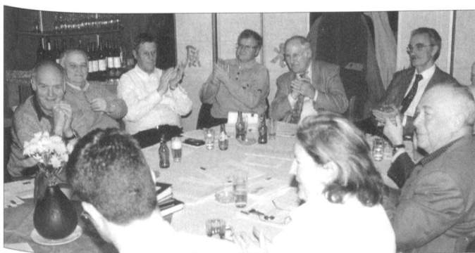
Une partie de l'assemblée attentive aux rapports.