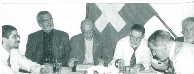
Les membres du comité réélus pour une année.