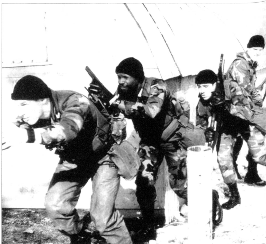
Zugriff «schwarzer» Kräfte.

Das soll nun anders werden. Die wenigen Operateure, die auch nur mit Wasser kochen und keinesfalls unbesiegbare «Supermänner» sind, erhalten immer mehr zusätzliche Aufgaben. Offiziell, um der völlig über-