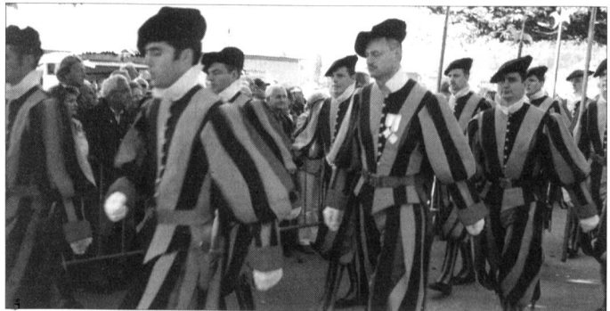
«Rom und Sparta sind untergegangen. Die Schweizergarde lebt.» Ehemalige defilieren an der 500-Jahr-Feier der päpstlichen Schweizergarde in Luzern (Bilder oben und unten).