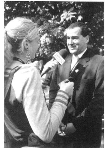
Der Kommandant der aktiven Schweizergarde Oberst Elmar Theodor Mäder war ein gesuchter Interview-Partner.