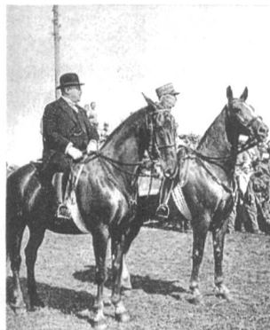
Minger und der General in Saigueléger