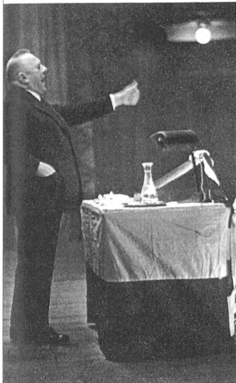
So sprach Rudolf Minger am 11. Jan. 1944 im Alhambrasaal in Bern zu 2000 Zuhörern