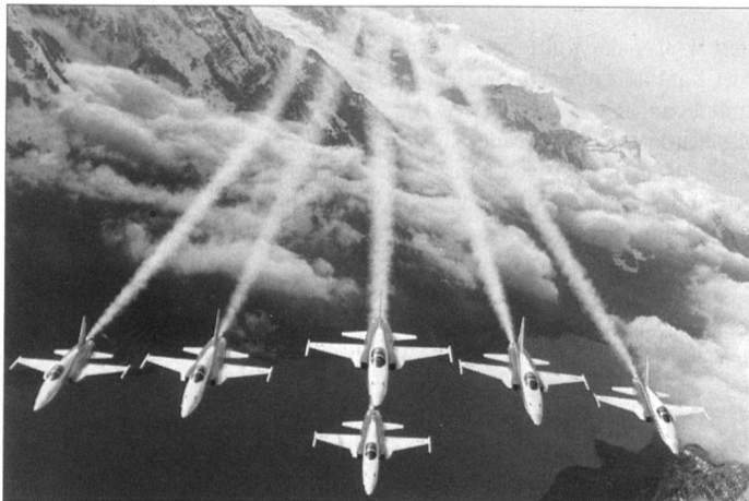
Patrouille Suisse, Formation Delta.