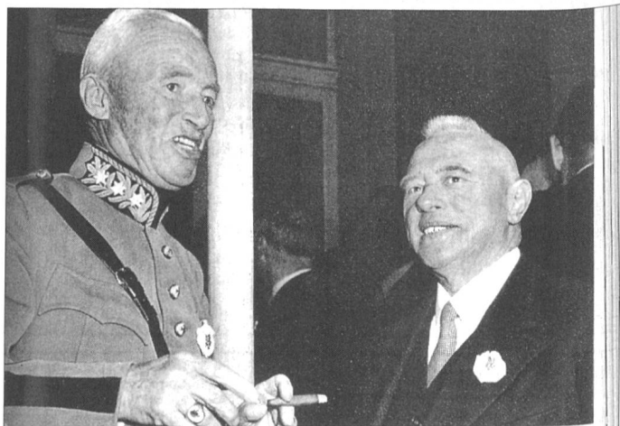
Die beiden Freunde Rudolf Minger und General Guisan

1909 wird Rudolf Minger Präsident der landwirtschaftlichen Genossenschaft Schüpfen und zwei Jahre später Mitglied des Vorstandes und der Verwaltungskommission des bernischen Genossenschaftsverbandes. Er