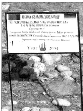
Gemeinsame Baustelle in Feyzabad.

Bis Mitte 2004 trafen 66 400 Fluggäste ein, über 5000 Tonnen Luftfracht wurden abgefertigt. An Fluggerät stehen sieben Transall C-160 und fünf mittlere Transporthub-