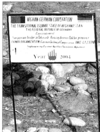
Gemeinsame Baustelle in Feyzabad.

Bis Mitte 2004 trafen 66 400 Fluggäste ein, über 5000 Tonnen Luftfracht wurden abgefertigt. An Fluggerät stehen sieben Transall C-160 und fünf mittlere Transporthub-