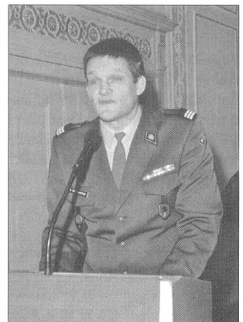
Unser Bild zeigt Schulkommandant Oberst i Gst Daniel Baumgartner. Weitere Bilder von Foto Zaugg finden Sie auf der vierten Umschlagseite.

Armee auch als Bürger zu zeigen und zu leben.