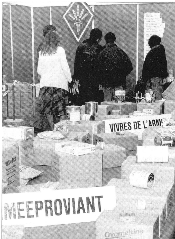
Einem steten Wandel war und ist die Bevorratung von Proviant unterworfen.

Dès 1880 l'armée suisse a introduit les magasins des subsistances, les vivres de l'armée et la consommation obligatoire. Avant la 2 ème guerre mondiale l'économie de guerre a été constituée pour assurer l'approvisionnement du pays. Depuis les années 1990 les stocks alimentaires pour la suisse ont pu être réduit sensiblement. En ce qui concerne l'armée, elle a abandonné la consommation obligatoire des vivres de l'armée au 1 er janvier 2005.