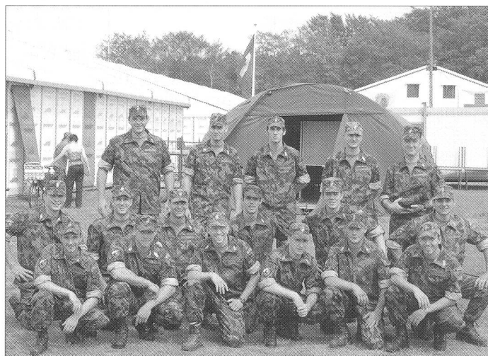
Gut gelaunte Teilnehmer im Camp.

Es gibt die Möglichkeit 30, 40 oder 50 km an vier Tagen zu absolvieren. Für militärische Teilnehmer sind 40 km am Tag und 10 kg Gepäck vorbestimmt. Um diese Leistung mit möglichst wenig Strapazen erbringen zu können, müssen vorher mindestens 300 km in der Gruppe trainiert wer-