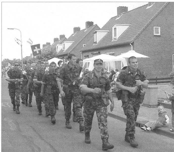
Ein besonderes Erlebnis – ein- oder mehrmals am Viertagemarsch von Nijmegen teilzunehmen.