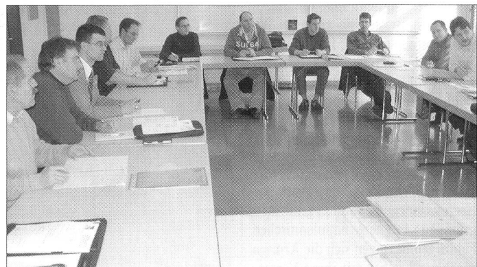
Einige der 15 Teilnehmer an der Präsidentenkonferenz in der Kaserne Aarau.

Major Lindt, Grundzüge der Verpflegung, o.O., 1889