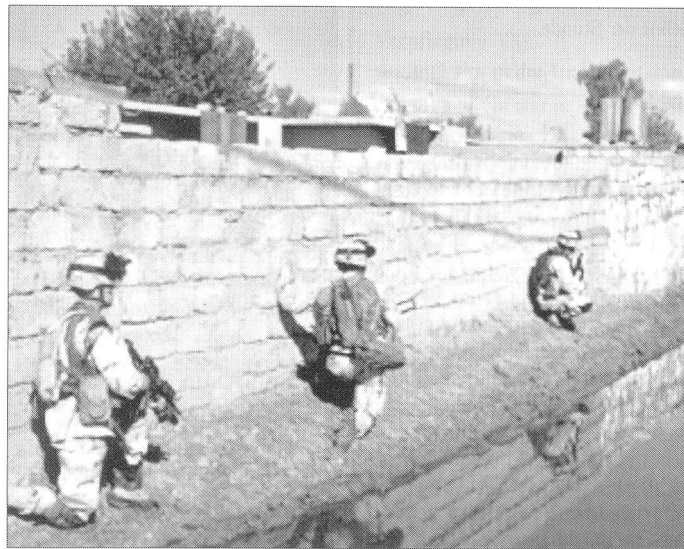
Der gefährliche Dienst im Irak fordert täglich seinen Tribut.

Täglich erschüttern uns grauenvolle Bilder über einen grausamen Kleinkrieg aus dem Zweistromland im Mittleren Osten. Einem schnellen militärischen Sieg folgte eine chaotische Situation mit tückischen Morden, Selbstmordattentaten und sinnloser Gewalt.