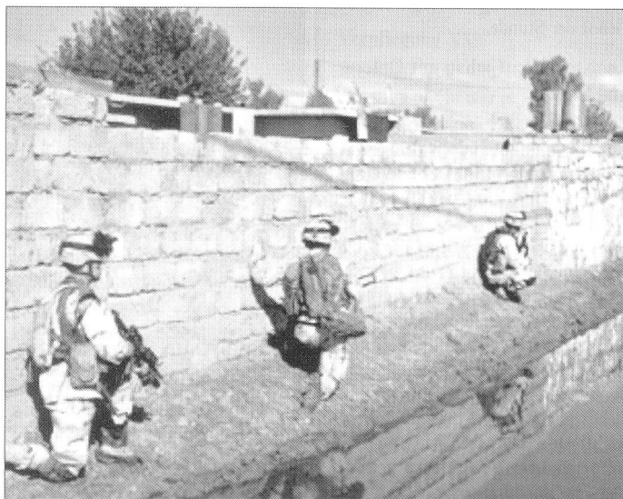
Der gefährliche Dienst im Irak fordert täglich seinen Tribut.

Täglich erschüttern uns grauenvolle Bilder über einen grausamen Kleinkrieg aus dem Zweistromland im Mittleren Osten. Einem schnellen militärischen Sieg folgte eine chaotische Situation mit tückischen Morden, Selbstmordattentaten und sinnloser Gewalt.